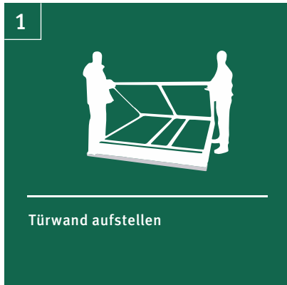
1 Türwand aufstellen