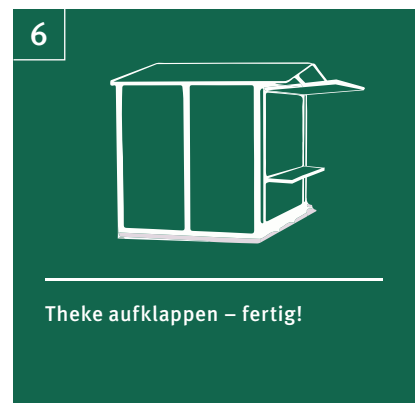
6 Theke aufklappen – fertig!

VARMA® – EINE MARKE VON DÖRICH METALLBAU