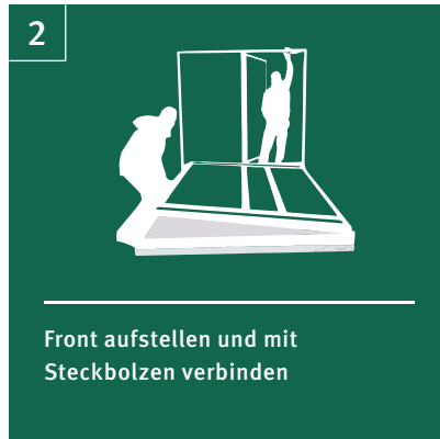
2 Front aufstellen und mit Steckbolzen verbinden