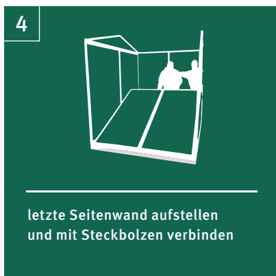
4 letzte Seitenwand aufstellen und mit Steckbolzen verbinden