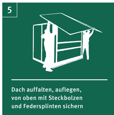
5 Dach auffalten, auflegen, von oben mit Steckbolzen und Federsplinten sichern