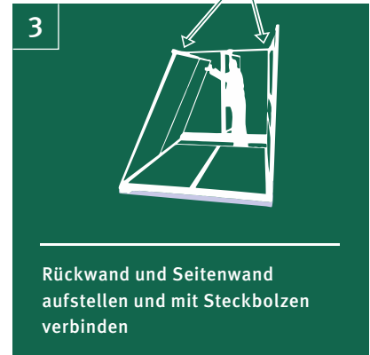
3 Rückwand und Seitenwand aufstellen und mit Steckbolzen verbinden